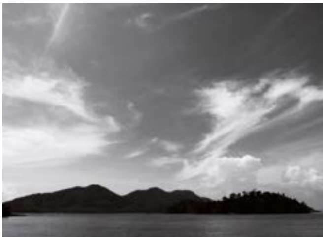
Vue de Moana Fa'a'aro Panorama des côtes de l'île réalisé en 2008, lors de l'expédition sur l' Antichtone . Impression numérique sur papier, dimensions variables, 2018

Paul Ardenne, «Du réel à l'imaginaire et vice-versa», une commande de Documents d'artistes Nouvelle-Aquitaine, www.dda-aquitaine.org , 2017