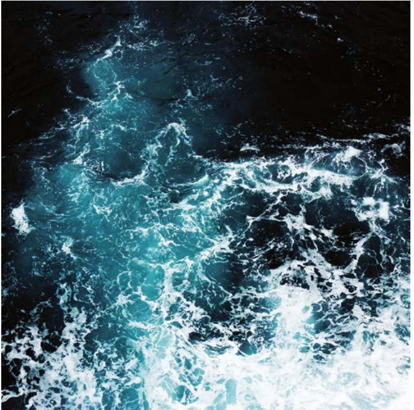
Surfaces - Méditerranée 4

www.dda-aquitaine.org/fr/aurelien-mauplot/