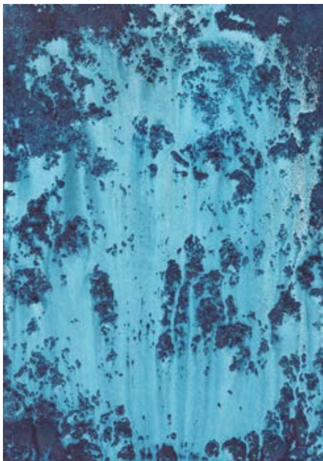
Les eaux obscures Abstraction des paysages ou évocation de l'invisible. Acrylique et neige sur papier, 21 x 29,7 cm, 2018

Reconfiguration, réappréciation, l'art a cette finalité d'abord, pour Aurélien Mauplot, inventer des métamondes. Citons, entre ceux-ci, le cycle « Subisland » cité plus avant, une exploration encore, sur le modèle du « Renversement du monde » mais consacrée cette fois aux abysses, ou encore « Géographie instable », qui s'inspire de la vision du monde colonial du 19 e siècle, utilitariste et occidentalocentrée. L'offre de ces mondes à côté du monde, imaginaires peut-être mais sources toujours de réflexion, est l'occasion de repositionner notre regard, notre sens de la condition humaine, notre pulsion aussi aux mythologies. Protéiforme (peinture, dessins, montages, vidéo), l'œuvre se déploie ici sous forme élargie comme l'équivalent d'une documentation. L'artiste y tire les leçons de l'art conceptuel – qui, en son temps, goûtait d'exposer des idées plus que des formes – en y adjoignant une part d'interprétation libre et ouverte, jouant de ce principe d'équivalence, l'irréel vaut le réel.