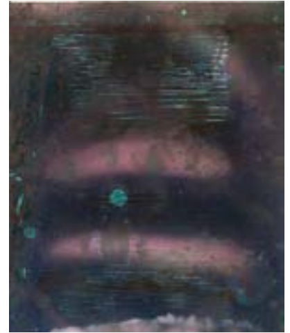
Les impatiences (série des nuages) Photographies retrouvées et prises lors du voyage autour du monde de l'Antichtone (2004/2008) Impression numérique, neige, clou et feu sur papier, 10 x 15 cm, 2019

Musée Picasso d'Antibes et Centre International de Valbonne (public : élèves de 5 ème , 2 de , Terminale et SEGPA)