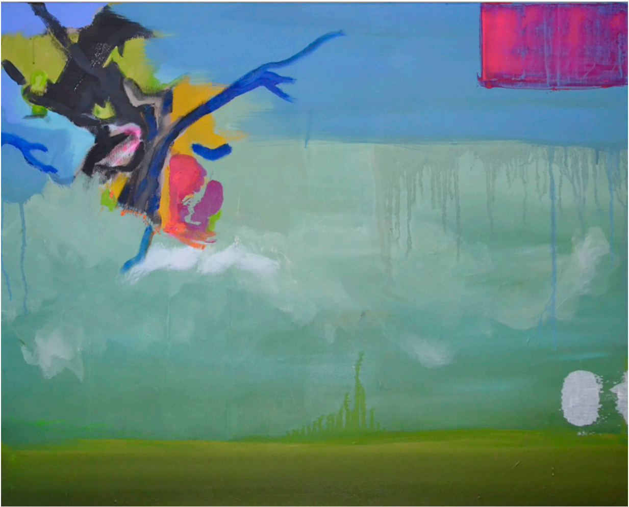
Valeurs inversées / Chocs - huile sur toile - 80 x 100 cm - 2018

Né en 1975, Florent Contin-Roux vit et travaille à Limoges et Saint-Victurien.